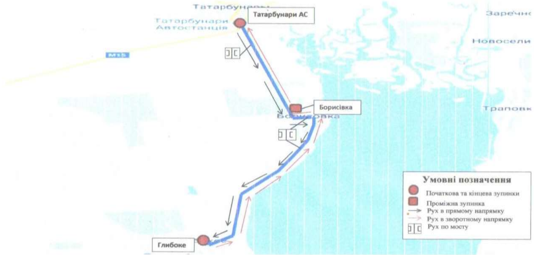
СХЕМА ПРИМІСЬКОГО АВТОБУСНОГО МАРШРУТУ № 36 «ТАТАРБУНАРИ АС - ГЛИБОКЕ»

ЗАТВЕРДЖЕНО Рішення виконавчого комітету Татарбунарської міської ради 09.08.2024 № 182